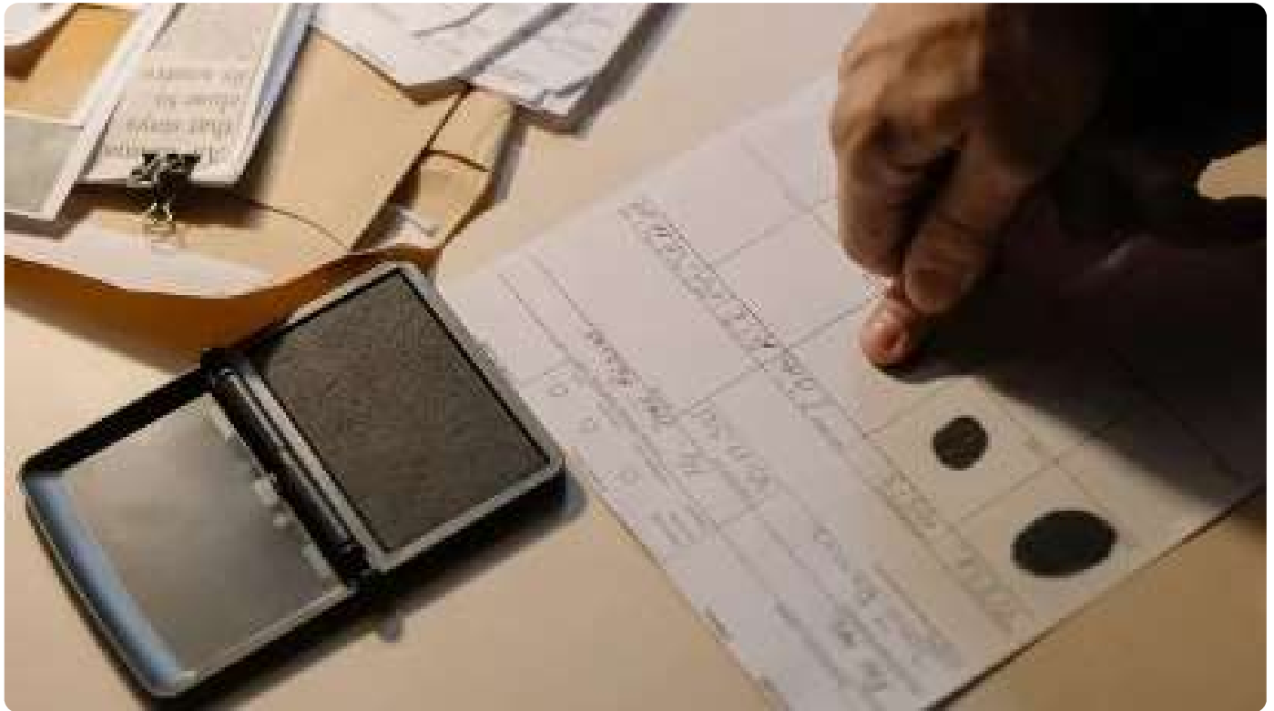
DELITO. Imagen referencial sobre el robo de datos y suplantación de identidad.

La clonación de voz en tres segundos y el uso de 'deepfakes' sofistican la suplantación de identidad en Ecuador. A través de este delito se pueden cometer otros como amenazas, extorsiones y obtención fraudulenta de créditos bancarios.