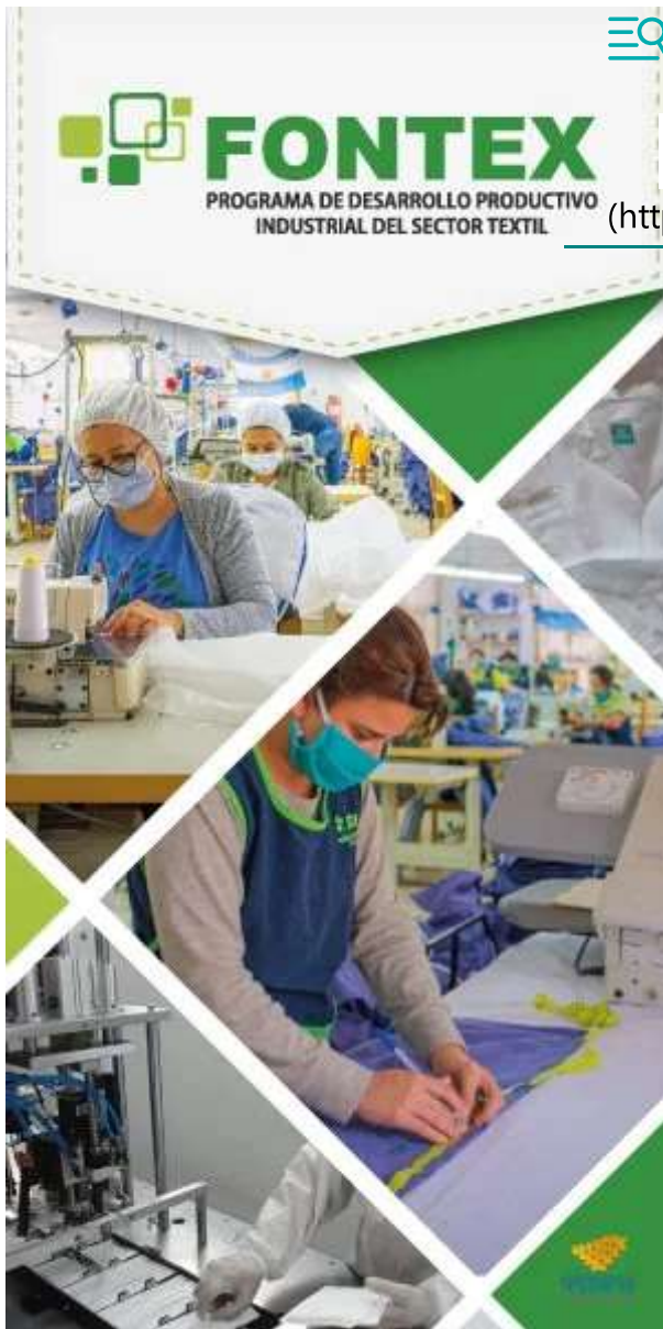
( https://neahoy.com )