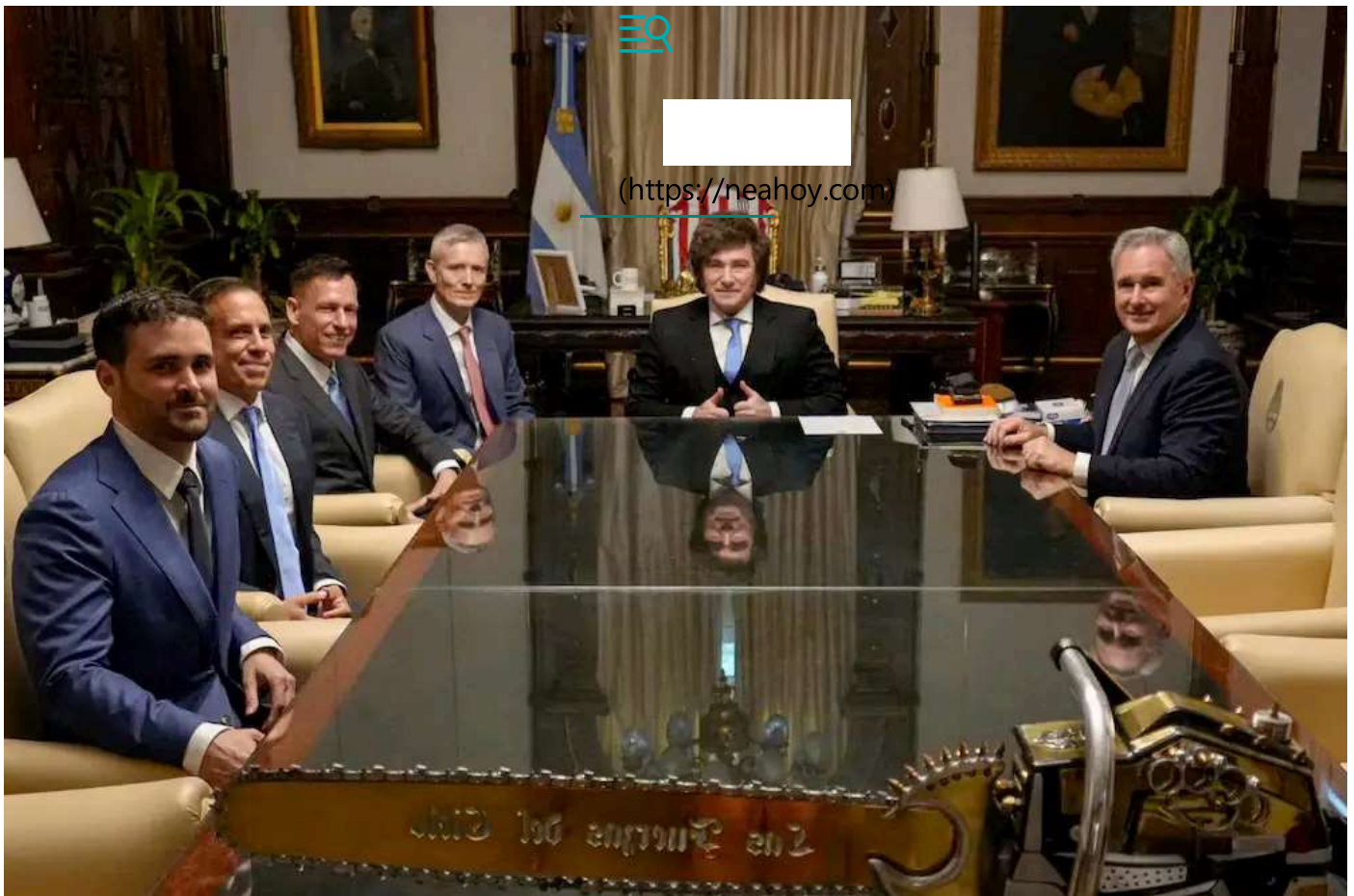
Reunión en Casa Rosada entre Peter Thiel y Milei. Posteriormente se supo que el multimillonario se instalará en Argentina.

En el marco de la entrevista, se comentó el caso de Formosa que se destaca por haber incorporado a los derechos digitales dentro de su Constitución para fortalecer las políticas públicas en este sentido. “Me parece súper bien que una provincia tenga en su Constitución la defensa de los derechos digitales, ojalá más provincias lo hagan, ojalá el país lo haga” , destacó Bonifaz durante la charla, ya que considera que ante la presencia de una empresa como Palantir, la educación digital es fundamental a la hora de saber protegerse.