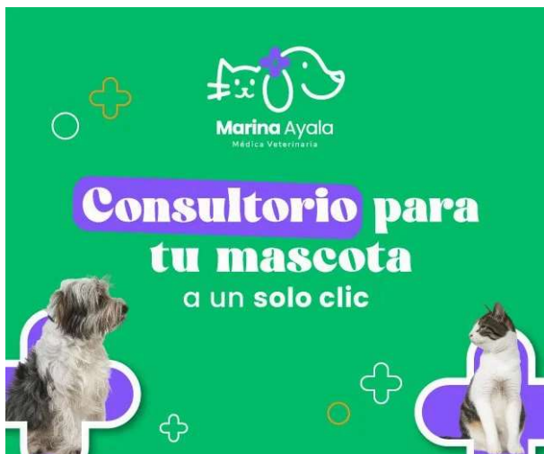
( https://www.instagram.com/dramarinaayala/?hl=es )