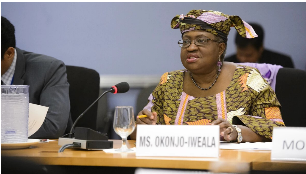
Ngozi Okonjo-Iweala, chefe da OMC, participou de discussões sobre comércio digital sob pressão de empresas de tecnologia