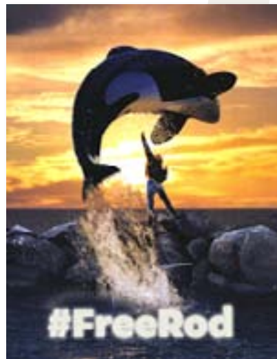
Imagen símbolo del caso en las redes sociales. #FreeRod

El caso fue prontamente recogido por los medios nacionales e internacionales. Los locales, particularmente, se mostraron en primera instancia afines a la tesis de Luksic. Con todo, luego de una interesante y amplia polémica que incluyó prensa, televisión, radios y medios online, con reportajes, crónicas, cartas, editoriales y columnas de opinión, las posiciones terminaron por avalar la tesis de que se trataba de un caso de amenaza a la libertad de expresión.